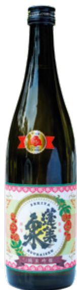
関谷醸造 東京農大の花酵母 「プリンセス・ミチコ」で 試験醸造をした日本酒